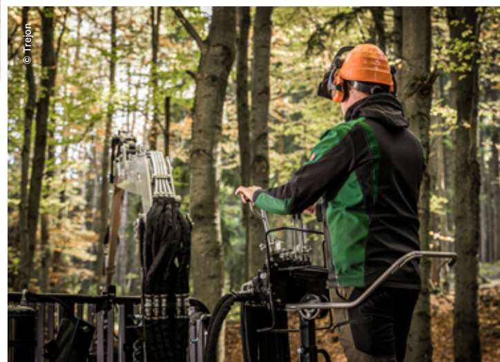
Stehplattform auf der Deichel für eine optimale Sicht.